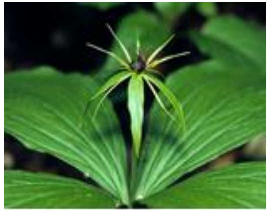
Vraní oko čtyřlísté