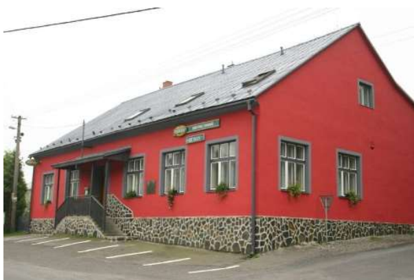
I Restaurace v Janovicích