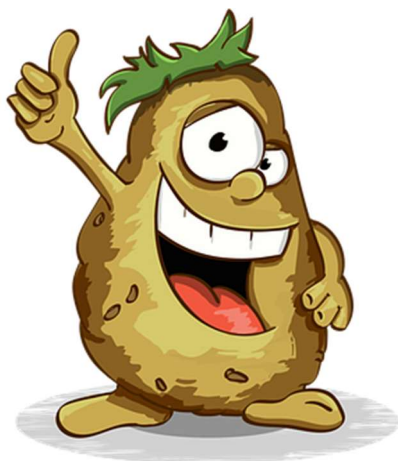
Příloha č. 1 - Pohádka o Brambůrkovi

Krásný sluníčkový den, moje milé děti. Jsem tady já, vaše Vyprávěnka, s ranní pohádkou. Pěkně se posadte, cinký linky, zvoní sluníčkový zvoneček a začíná pohádka.