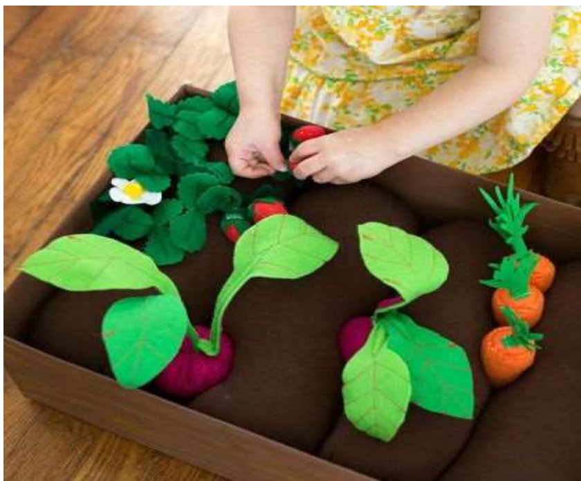
Příloha č. 4 - vyrobená zahrádka z textilií