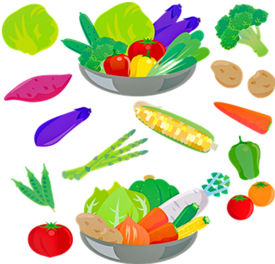
Příloha č. 3 - Obrázek zeleniny