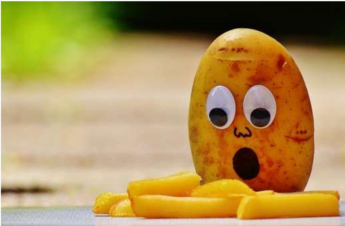
Příloha č. 2 - Jak vypadá brambor?