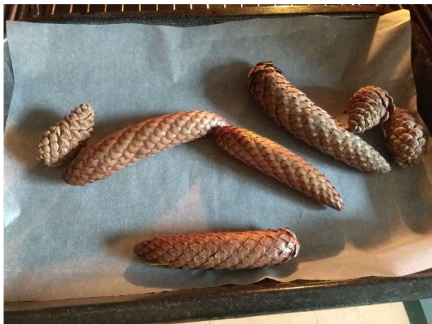
Obrázek 5 - Šišky v troubě před otevřením