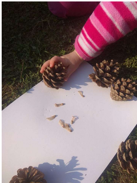
Obrázek 2 - Vysypávání semínek