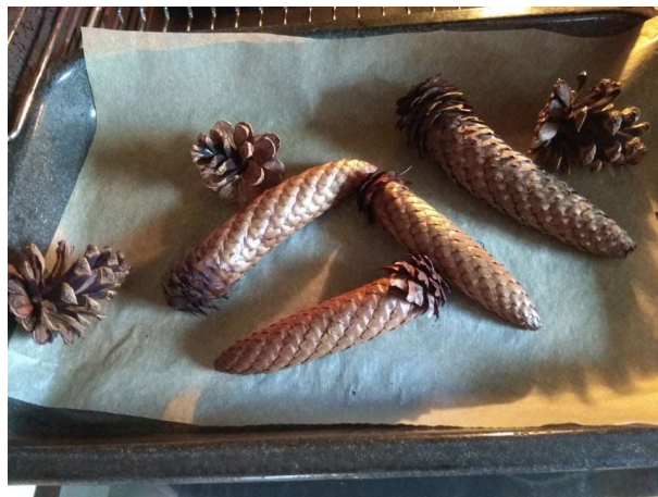
Obrázek 6 - Otevírání šišek po zahřátí v troubě.