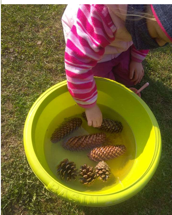
Obrázek 3 - Namáčení šišek