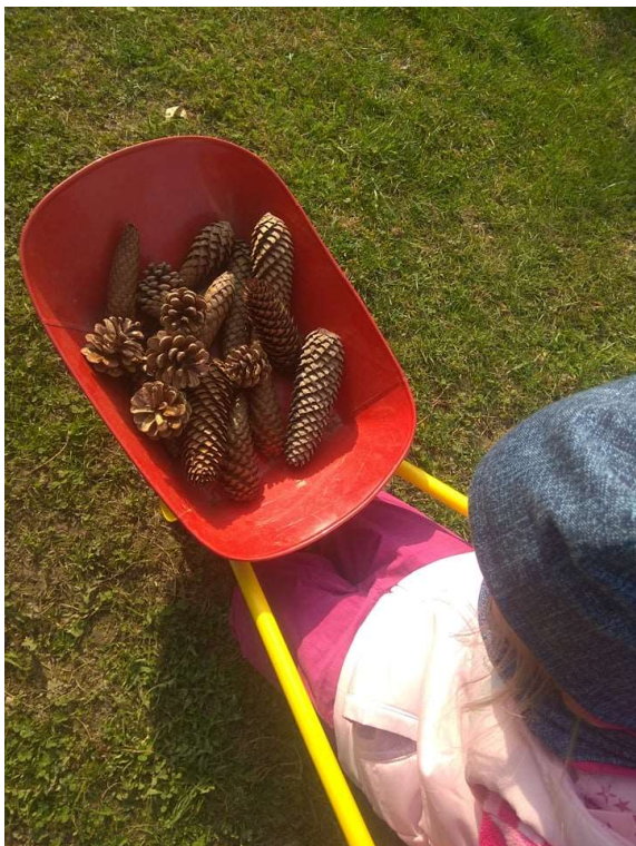
Obrázek 1 - Sbírání šišek

Výstup edukační činnosti: dítě má radost z objevu, že šiška skrývá semínka, a ví, k čemu semínka slouží. Dítě ví, že se šiška na slunci otevře a ve vlhku zavře.