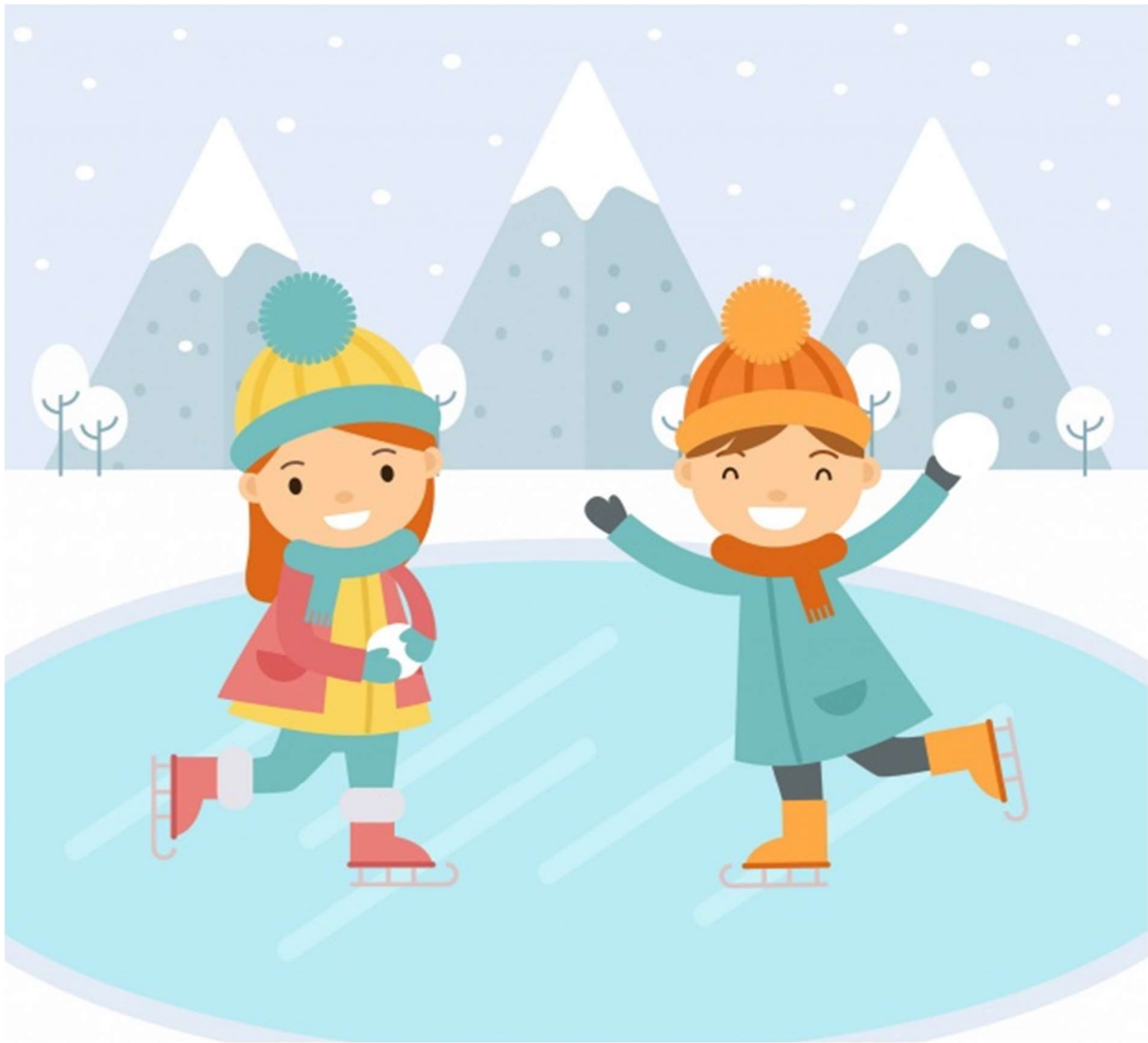
Příloha č. 12 - Jak Pepička cestovala – vločky sněhu roztají, změní se ve vodu, ale pod tíhou mrazivých teplot se promění v led, na kterém pak mohou děti bruslit