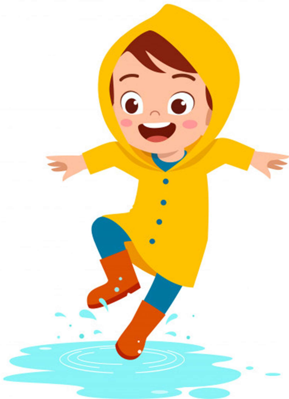
Příloha č. 7 - Jak Pepička cestovala – poté spolu s dalšími kapičkami vytvořila louži