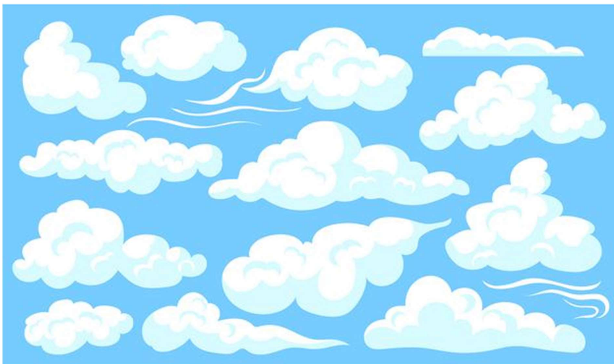
Příloha č. 9 - Jak Pepička cestovala – kapičky se vypařovaly, až se proměnily v obláčky