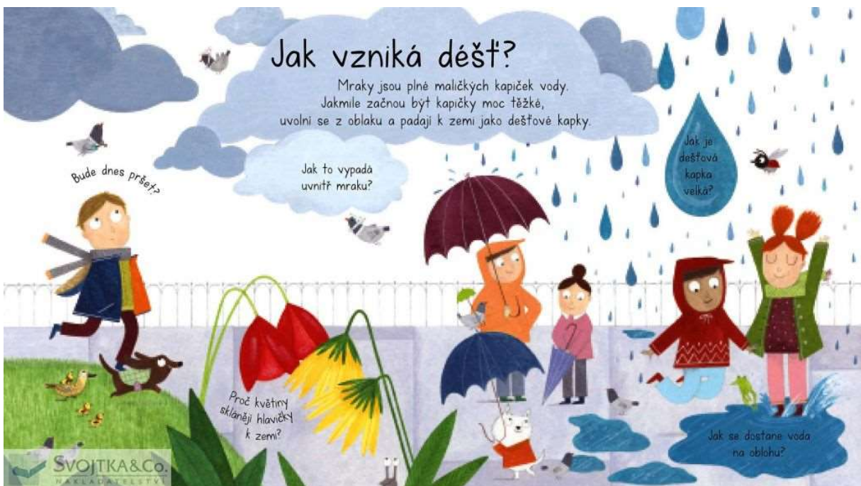
Příloha č. 13 - A pak znovu všechno dokola...