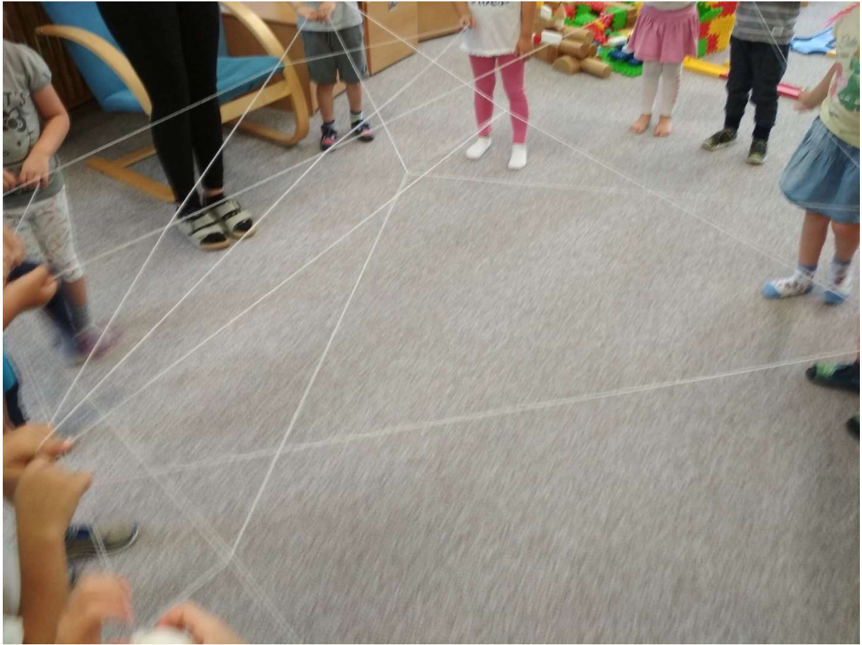
Obrázek 2 - Síť přátelství