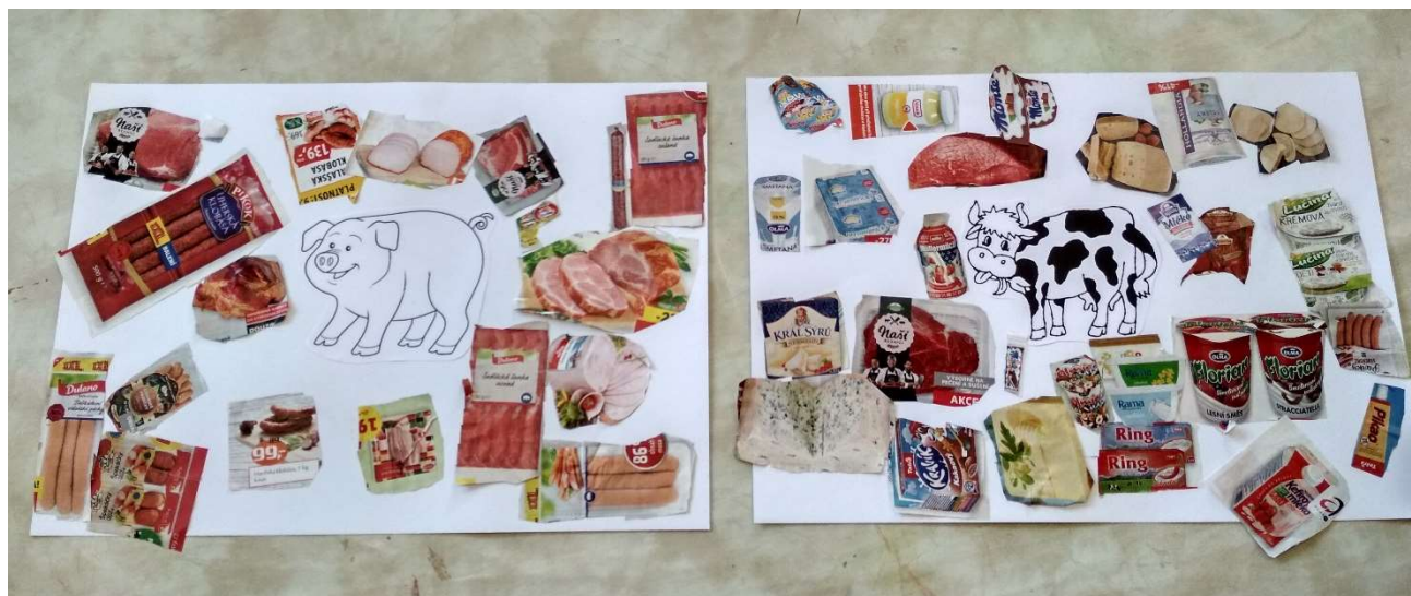
Obrázek 1 – vzor hotových výkresů

Výstup edukační činnosti: správně přiřazené produkty k daným zvířátkům